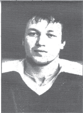
Николай ЗАВАРУХИН лучший нападающий сборной России